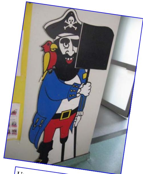
Un exemple de décoration