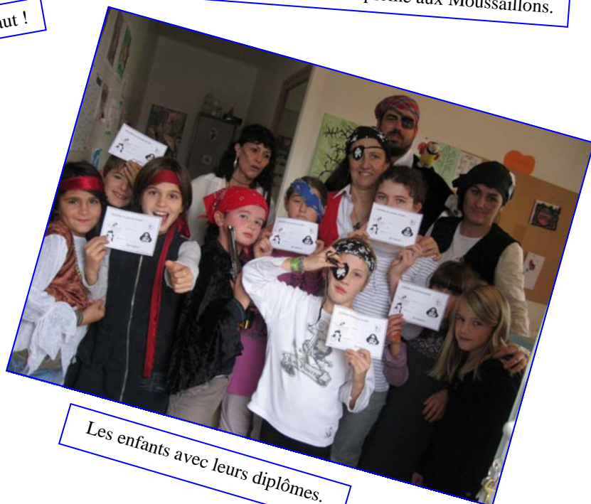
Les enfants avec leurs diplômes.