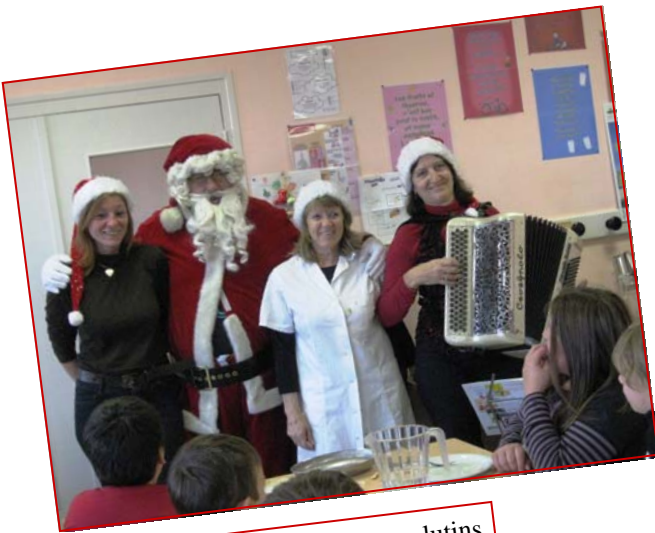
Le Père Noël et ses lutins