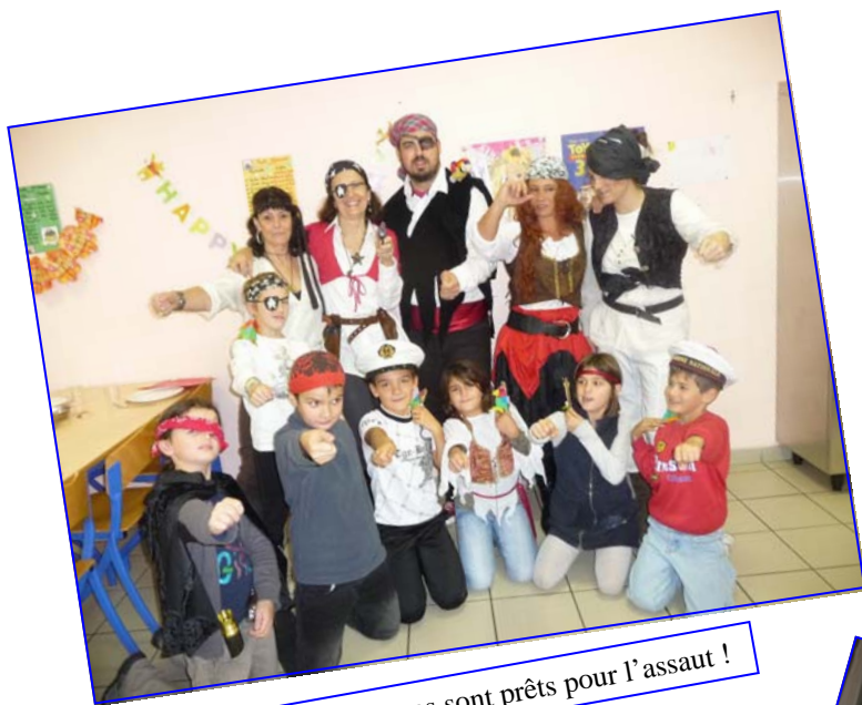
Attention, les petits mousses sont prêts pour l'assaut !

Les enfants ont énormément apprécié cette ambiance aventurière !