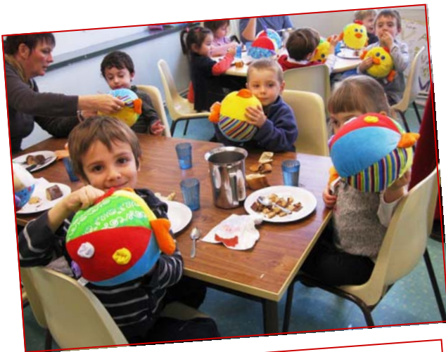
Les enfants étaient ravis de leurs cadeaux : des Peluches ballon pour les petits et des étoiles de mer clignotantes pour les plus grands.