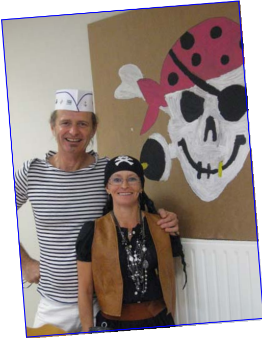
Les équipes de cuisine et service ont largué les amarres, pour le plus grand plaisir des enfants