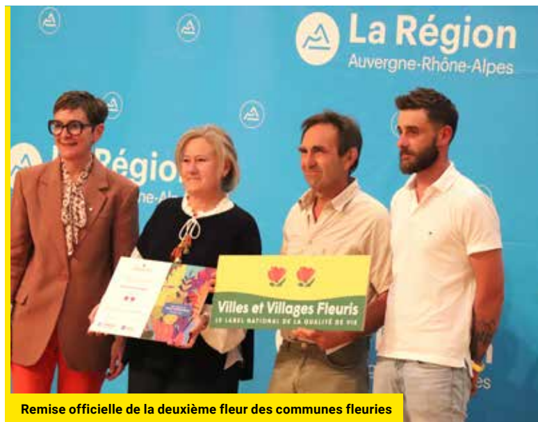
Remise officielle de la deuxième fleur des communes fleuries

Impression : Chirat sur papier 100% recyclé | Tirage : 8 100 exemplaires | N°322