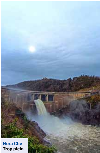
Nora Che Trop plein