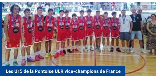
Les U15 de la Pontoise ULR vice-champions de France