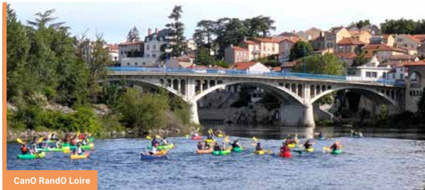
CanO RandO Loire