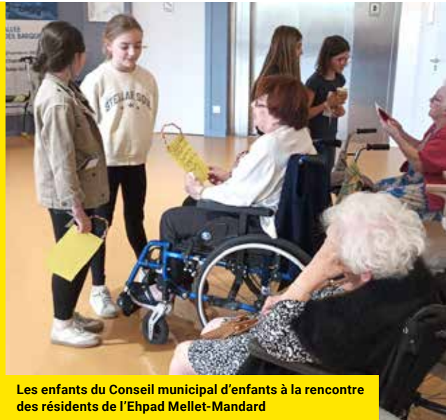
Les enfants du Conseil municipal d'enfants à la rencontre des résidents de l'Ehpad Mellet-Mandard