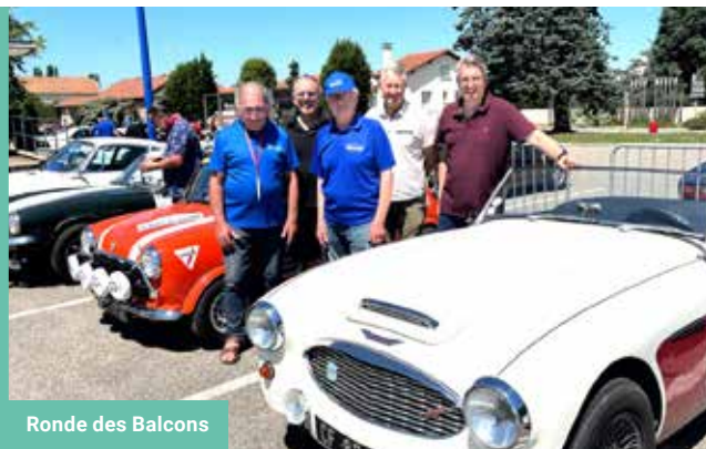
Ronde des Balcons