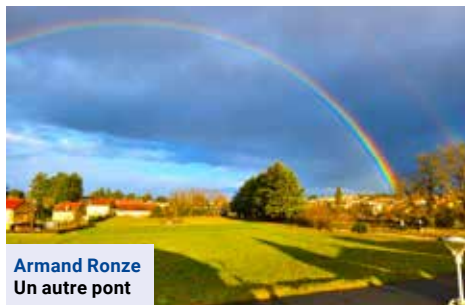
Armand Ronze Un autre pont