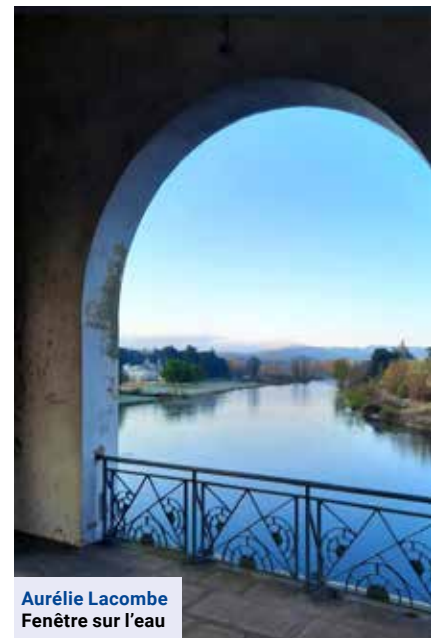
Aurélié Lacombe Fenêtre sur l'eau

Envoyez-nous vos plus belles photos pour apparaître dans un prochain numéro : communication@stjust-strambert.com