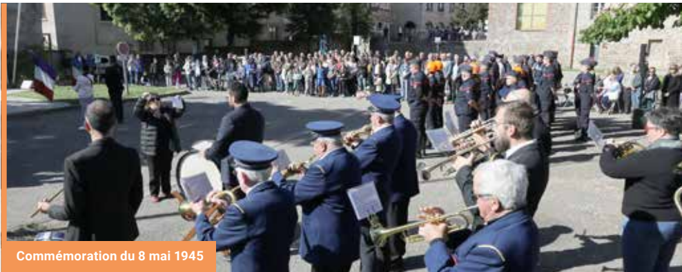
Commemoration du 8 mai 1945