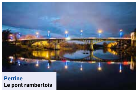
Perrine Le pont rambertois