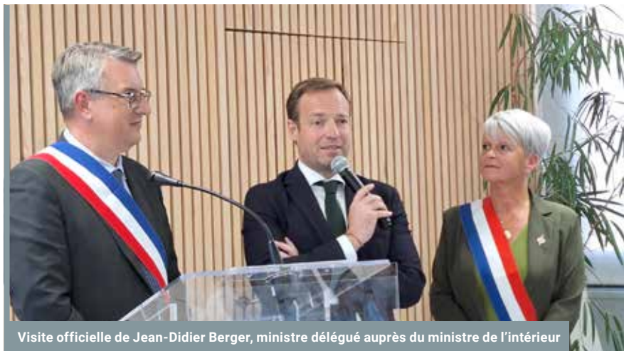
Visite officielle de Jean-Didier Berger, ministre délégué auprès du ministre de l'intérieur