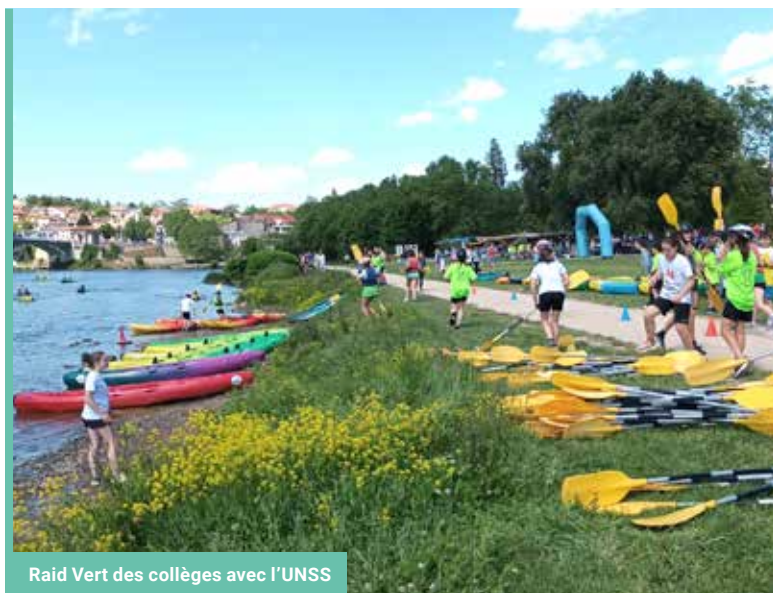
Raid Vert des collèves avec l'UNSS